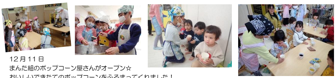
12月11日 まんた組のポップコーン屋さんがオープン☆ おいしいできたてのポップコーンをふるまってくれました!

くじら組の遠足日程変更のお知らせ 3月に予定しておりましたくじら組の遠足は、2月28日(金)にまんた組と合同で行くことになりました。詳細は別途お知らせいたします。