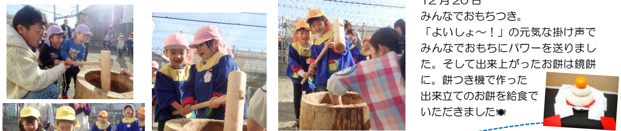
12月20日 みんなでもちつき。 「よいしょ〜!」の元気な掛け声でみんなでもちにパワーを送りました。そして出来上がったお餅は鏡餅に。餅つき機で作った出来立てのお餅を給食でいただきました!🍡