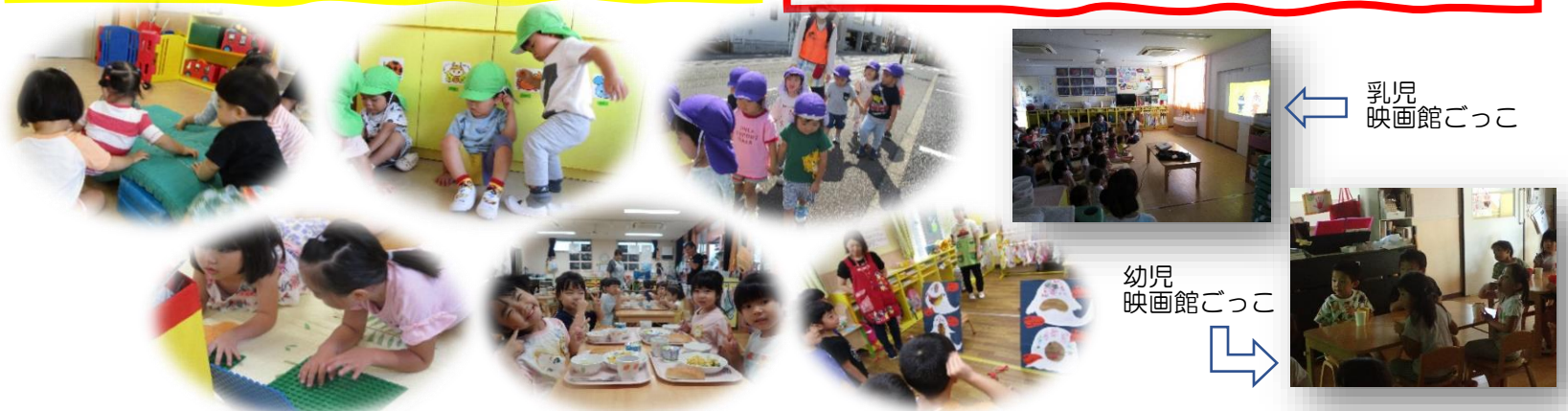
← 乳児 映画館ごっこ

【まんた】進級してから様々な野菜を育てて食べてきました。野菜が苦手だった児も「お友達と一緒にだから・・・」と少しずつ食べられるようになりました。自分たちで育てた野菜をたくさん食べて元気いっぱいの子も達は、今では運動会の練習を頑張っています。暑い中での運動に水筒の中身が空っぽになるほど一生懸命です♪