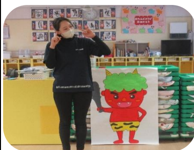
今年の鬼はかわいらしい鬼さんでした。