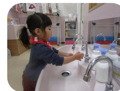
手も上手に洗えます♪