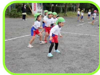
まんた組さんが、座間市保育士会主催の4園合同での “ドッチボール大会”に参加してきました。