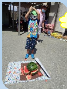
園長先生ががんばって!