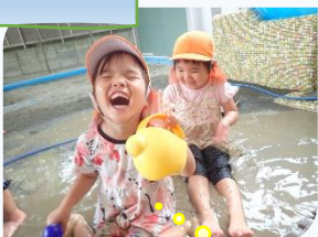
冷たくて気持ちいい!!