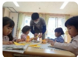
パパさんと折り紙制作。 みんな真剣に取り組んでいます。

今年度も残りわずかとなりましたが、1日1日を大切に、思い出を積み重ねていきたいと思っております。