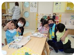
給食もパパさんと 一緒だとなんだか とっても嬉しいな😊