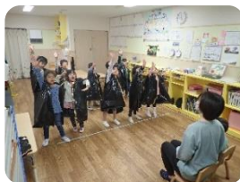
うんどうかいごっこで披露した「ようこそ 日本へ」をママさんの前で披露！