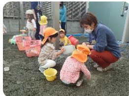
良いお天気の中で、園庭でお砂場遊び。 ママさんへ「はい、とーぞ」😊