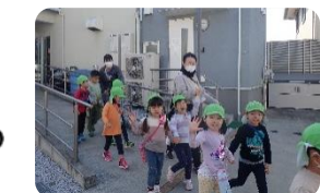
ママさんと一緒に元気にくつがた公園へ！ おなかペッコペコで帰ってきました～😊

「送り迎えの時や、子どもが話してくれる 内容だけではわからない、園での様子を見る ことができ、非常に有意義な時間でした。」等のお言葉を頂きました。