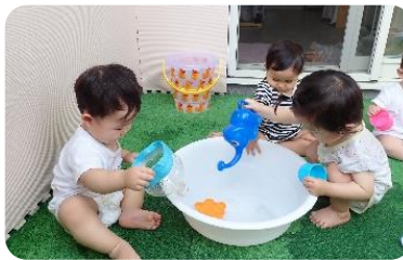
テラスで水遊び キラキラと流れる水に興味津々の かめ組さんです😊