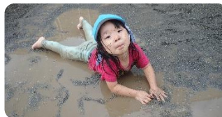
どろんこ遊び 園庭で水あそびからのどろんこ遊び！ どろんこになるのって楽しいですね〜。