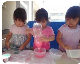
色水遊び この色とこの色をまぜて・・・ こんな色になるんだね〜 たくさん発見！実験水遊びです😊