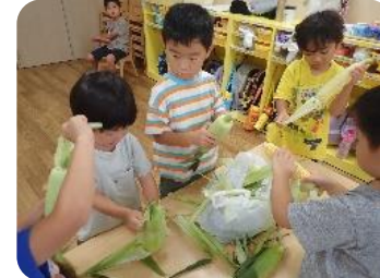
トウモロコシの皮むき おやつに食べるトウモロコシの皮をむく まんた組さん。 上手にむけたかな？