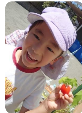
野菜の収穫 真っ赤に実ったミニトマト🍅 小さくカットして試食しました。 美味しかったかな？😊