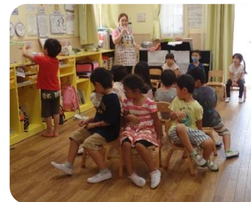
イス取りゲーム 音楽に合わせてグルグルグル。 ハラハラするけど、楽しい時間です😊