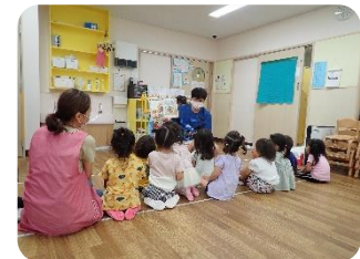
パパさんが読んでくれた「ぼくのしょうぼうしゃ」。みんな集中して聞いていますね~。