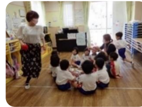
「ハンカチ落とし」...ハンカチをそっと置いて逃げるママさん。つかまらないように頑張って逃げます!!