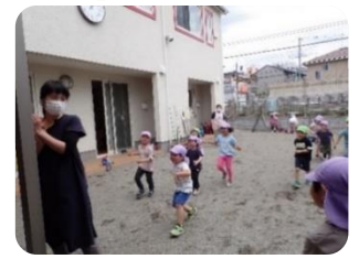
ママさんと一緒に「だるまさんがころんだ」で遊びました。汗びっしょりになりながらも楽しかったです。