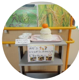
綾瀬ゆめっこ保育園 2021年1月4日