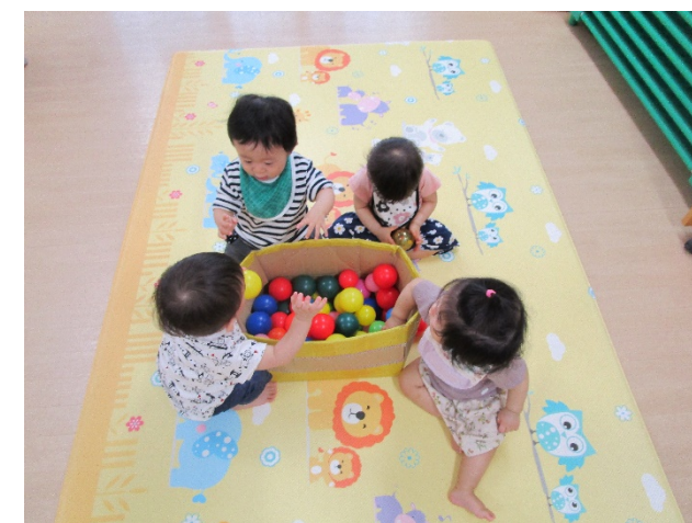
雨の日が多かったけど、お部屋の中で元気いっぱい遊んだよ!!!