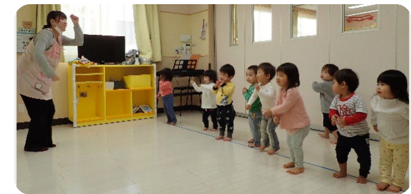
↑↓べんぎん組 みんなで横一列に並ぶことから始めます。ピシッと並べるようになってきました😊