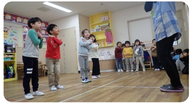
↑CDに合わせて繰り返し練習をする幼児クラス。だんだん上手になってきました😊