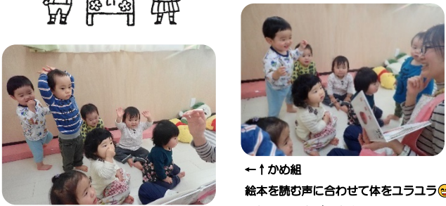
←↑かめ組 絵本を読む声に合わせて体をユラユラ😊 元氣にお返事ができました～。