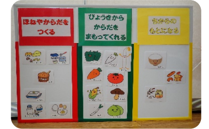
↑給食ボード 今日の給食はどんな野菜がはいっていたかな？ 調理室横に掲示予定です。お楽しみに😊