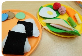
↑フェルトおもちゃ フェルト生地のおにぎりやサンドウィッチ♡ ピクニックごっこが始まりそうです😊