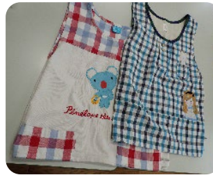
↑ミニエプロン ほいくえんごっこやお料理ごっこの時に♡