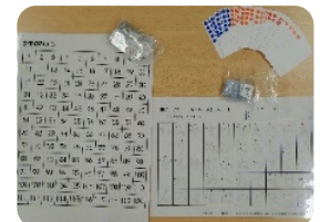
↑ひらがな・すうじボード さあ！ボードを使ってひらがなや数字の練習をしましょう😊