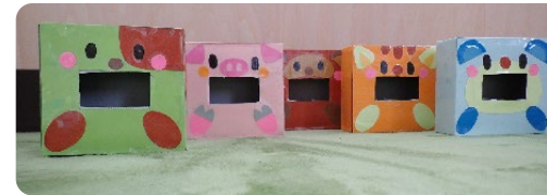
↑ボックスおもちゃ 小さく切ったスポンジなどを入れたり出したり・・・ 指先の細かな動きの練習です😊