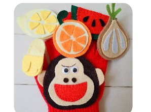
↑てぶくろシアター くいしんぼうのゴリラが、いろんな食べ物を食べちゃいます🍌