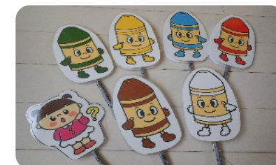
↑ペープサート みんな大好き「くれよんくん」。 絵本の中からやってきました😊