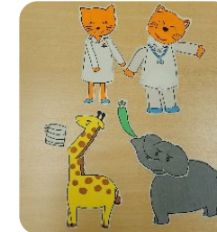
↑パネルシアター 動く「ねこのおししゃさん」のパネルシアターです。