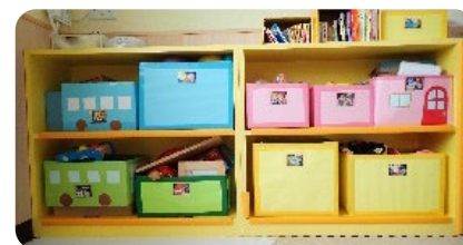
↑整理ボックス おもちゃをしまえるカラフルなボックス。 乳児クラスのおもちゃもキレイに収納できます🌸

在宅ワークにて、みんなのおもちゃなどを作りました。 1、2階廊下に展示しますので、ぜひお手に取ってご覧ください。 (展示終了後に、みんなで遊びます) 園だよりにて、一足先にほんの一部を紹介します♪